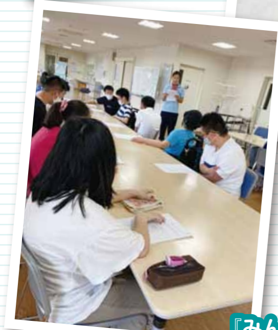
『みんなで食中毒の勉強会!!』