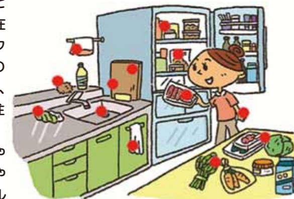
参考：厚生労働省HPより

きれいにしているキッチンでも、食中毒の原因となる細菌やウイルスがまったくいないとは限りません。食器用スポンジやふきん、シンク、まな板などは、細菌が付着・増殖したり、ウイルスが付着しやすい場所と言われています。