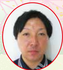
南東北グランプラス八山田