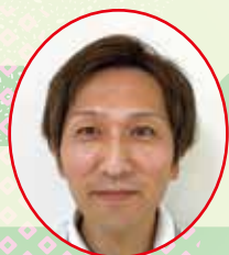
南東北デイサービスセンター八山田

謹んで新年のご挨拶を申し上げます。昨年は皆さまの温かいご支援とご協力に支えられ、無事に過ごす事が出来ました事、心より感謝申し上げます。新しい一年が皆様にとって、穏やかで幸せな日々となりますよう、職員一同、全力でサポートさせていただきます。これからも一緒に笑顔で過ごし素敵な思い出を作っていける事を楽しみにしております。本年もどうぞよろしくお願い申し上げます。