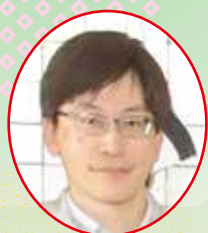
南東北八山田居宅介護支援事業所

新年あけましておめでとうございます。謹んで新年のご挨拶を申し上げます。 デイサービスでは干支の壁画を作成しました。干支の午年にあやかり、エネルギーに前進する飛躍の年といたします。皆様の益々のご健勝をデイサービス職員一同お祈り申し上げます。