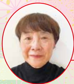
総合南東北福祉センター八山田 センター長