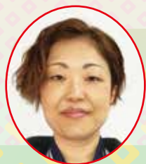
南東北ライフステップ八山田

新年を迎え、心新たにスタートしました。昨年の12月から異動となり、まだまだ不慣れな面もありますが、職員と協力しながら頑張っていきます。 子どもたちの笑顔と成長を大切にしながら安心して過ごせる場所と支援を提供できるよう取り組んでいきたいと思ひます。