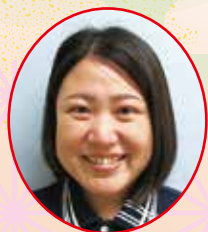
ジョブステップ八山田

新年あけましておめでとうございます。地域の皆さまに寄り添い、安心して在宅生活を続けていただけるよう、職員一同連携を深め、より良い支援に努めてまいります。本年もよろしくお願いいたします。