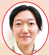
さくらんぼ・すだち

謹んで新年のご挨拶を申し上げます。 旧年中は、利用者様・ご家族様に多大なるご理解とご協力を賜り、心より感謝申し上げます。 新体制となりましたジョブステップですが、本年も、利用者様一人ひとりの目標やペースを大切にしながら、安心して通所していただけるよう職員一同、より良い支援に努めてまいります。 皆さまによって健やかで実り多き1年となりますよう心よりお祈り申し上げます。